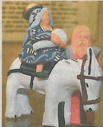
»Flucht nach Ägypten«: Die Figurengruppe ist aus Ton hergestellt.

Im Mittelpunkt des Afrikaraums des Museums steht ein Krippenbaum aus Zedernholz, der ringsum beschnitzt ist und das christliche Weihnachtsgeschehen von der Verkündigung bis zur Flucht der Heiligen Familie nach Ägypten darstellt. Die weiteren Ausstellungsstücke in diesem Raum des Museums stammen aus Tansania, Ruanda, Togo, Kamerun, Kenia, Senegal, Burkina-Faso, dem Kongo und aus Ägypten. Um die Präsentation der Ex-