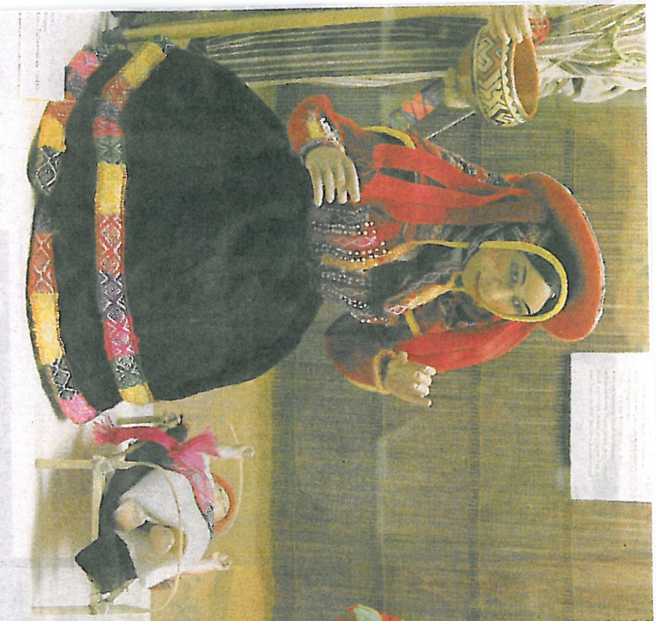
Bunt, vielseitig, selten: Die Krippenausstellung in Glattbach zeigt Exotisches, wie Maria in peruanischer Tracht, oder Ausgefällenes, wie die heilige Familie in der Perlmuttermuschel.