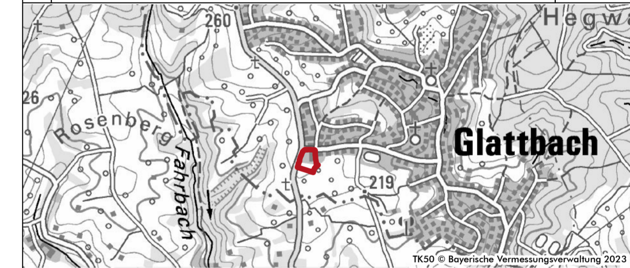
Bebauungsplan „Auf der Weitzkaut“ 6. Änderung