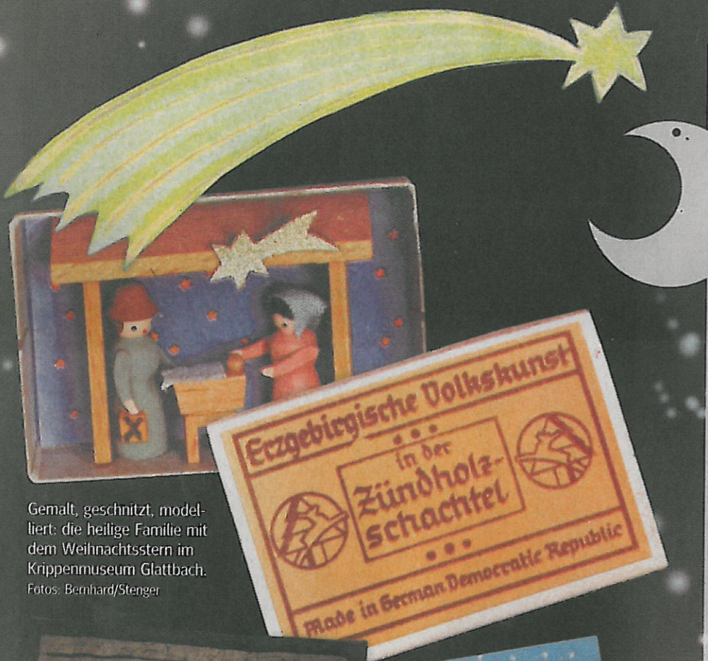
Gemalt, geschnitzt, modelliert: die heilige Familie mit dem Weihnachtsstern im Krippenmuseum Glattbach.