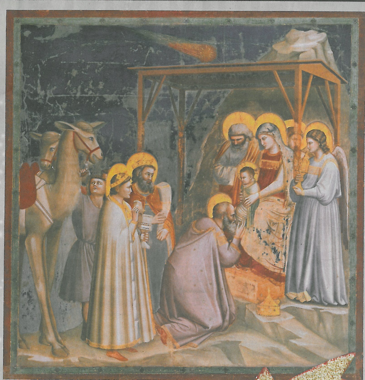
Kapellen-Fresko aus dem 14. Jahrhundert: Giotto's »Anbetung der Heiligen Drei Könige«.